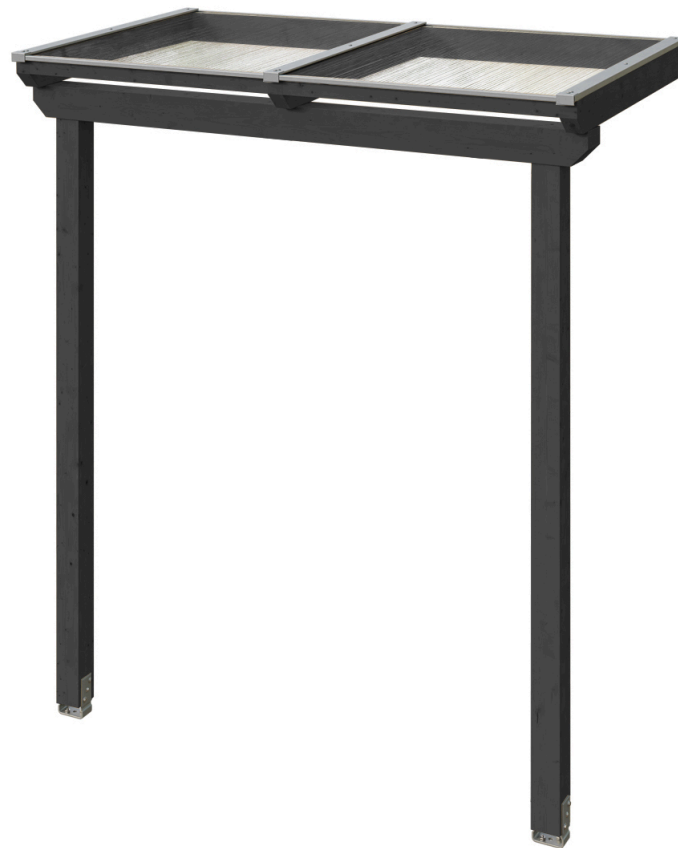
VORDACH ANKLAM 1 220 x 124 cm

Massive Konstruktion aus hochwertigem Leimholz (BSH-Fichte)