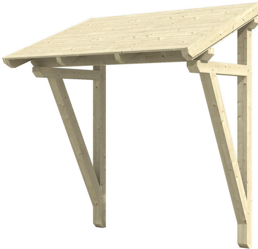
VORDACH PADERBORN 2 242 x 156 cm

Massive Konstruktion aus Konstruktionsvollholz (KVH-Fichte)