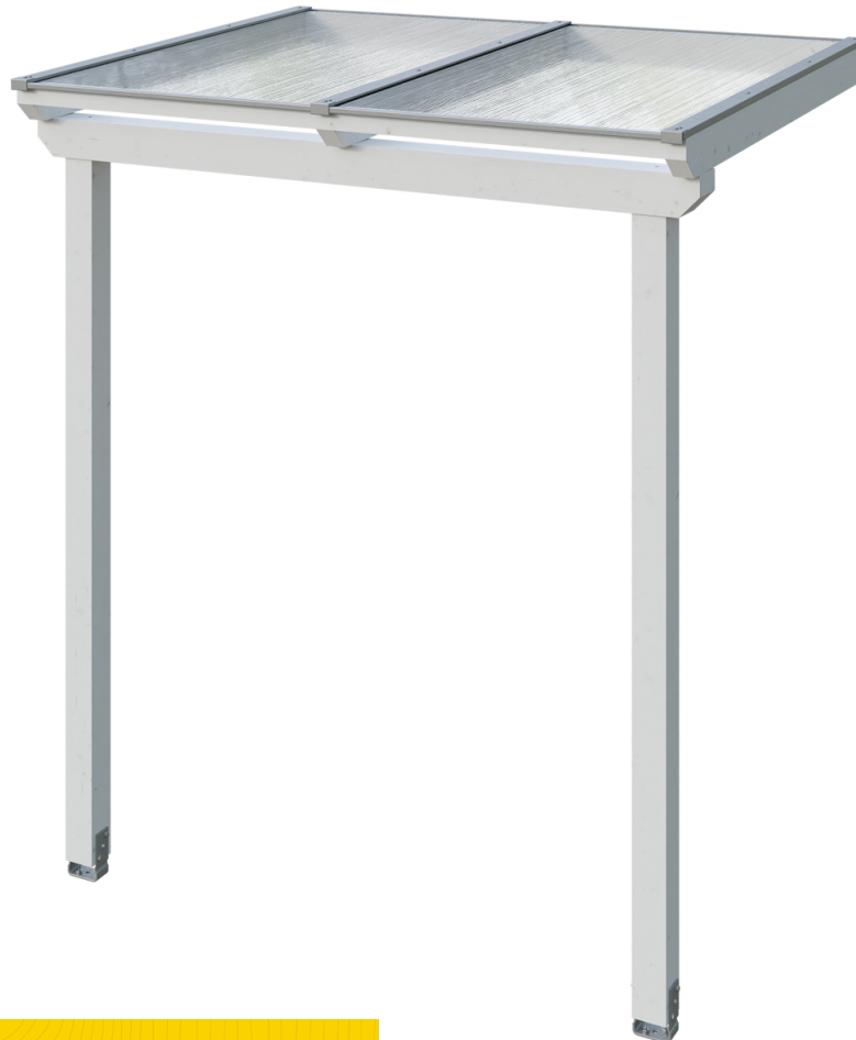
VORDACH ANKLAM 2 220 x 174 cm

Massive Konstruktion aus hochwertigem Leimholz (BSH-Fichte)