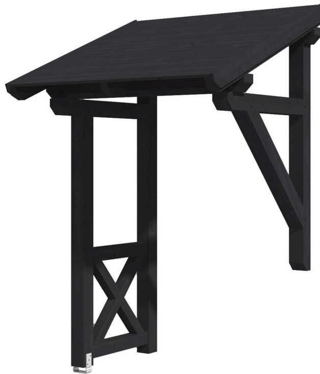
VORDACH POTSDAM 3 176 x 156 cm

Massive Konstruktion aus Konstruktionsvollholz (KVH-Fichte)