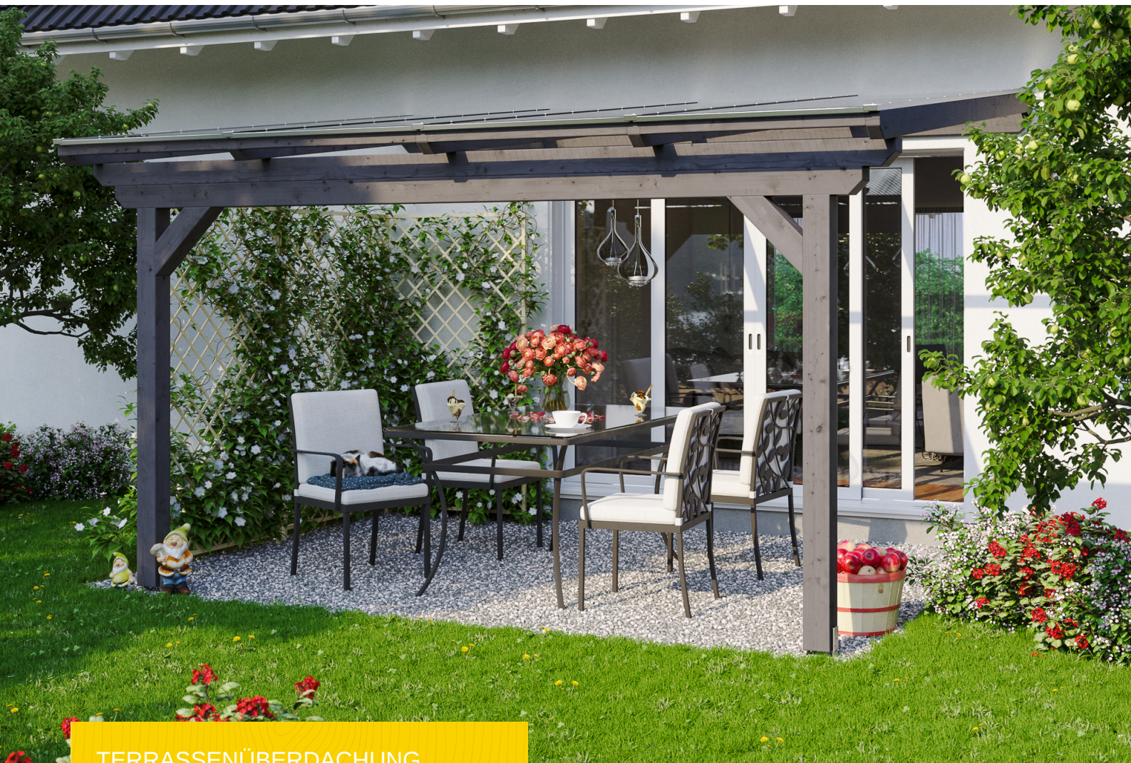
TERRASSENÜBERDACHUNG ANCONA 434 x 300 cm