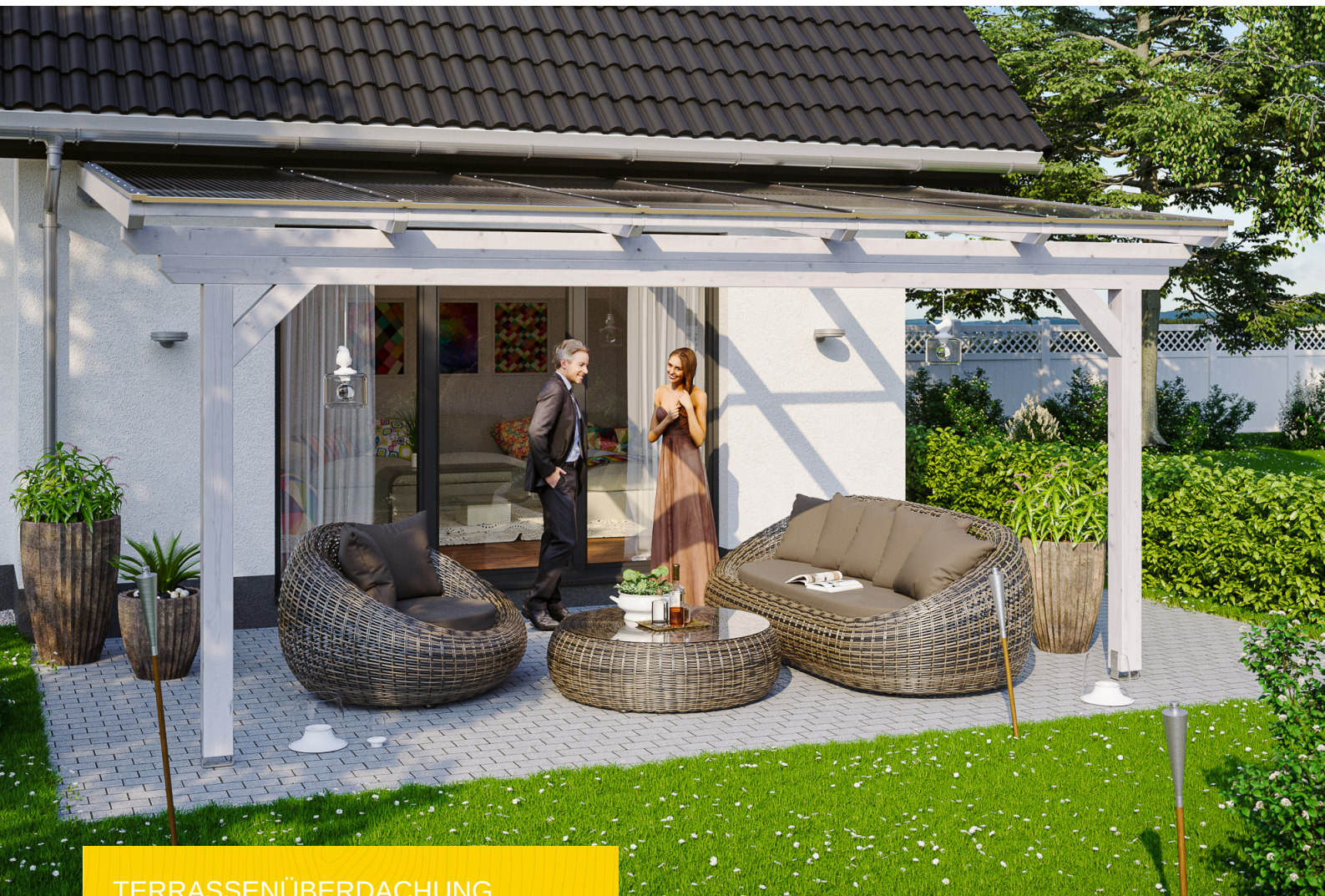
TERRASSENÜBERDACHUNG ANCONA 541 x 300 cm