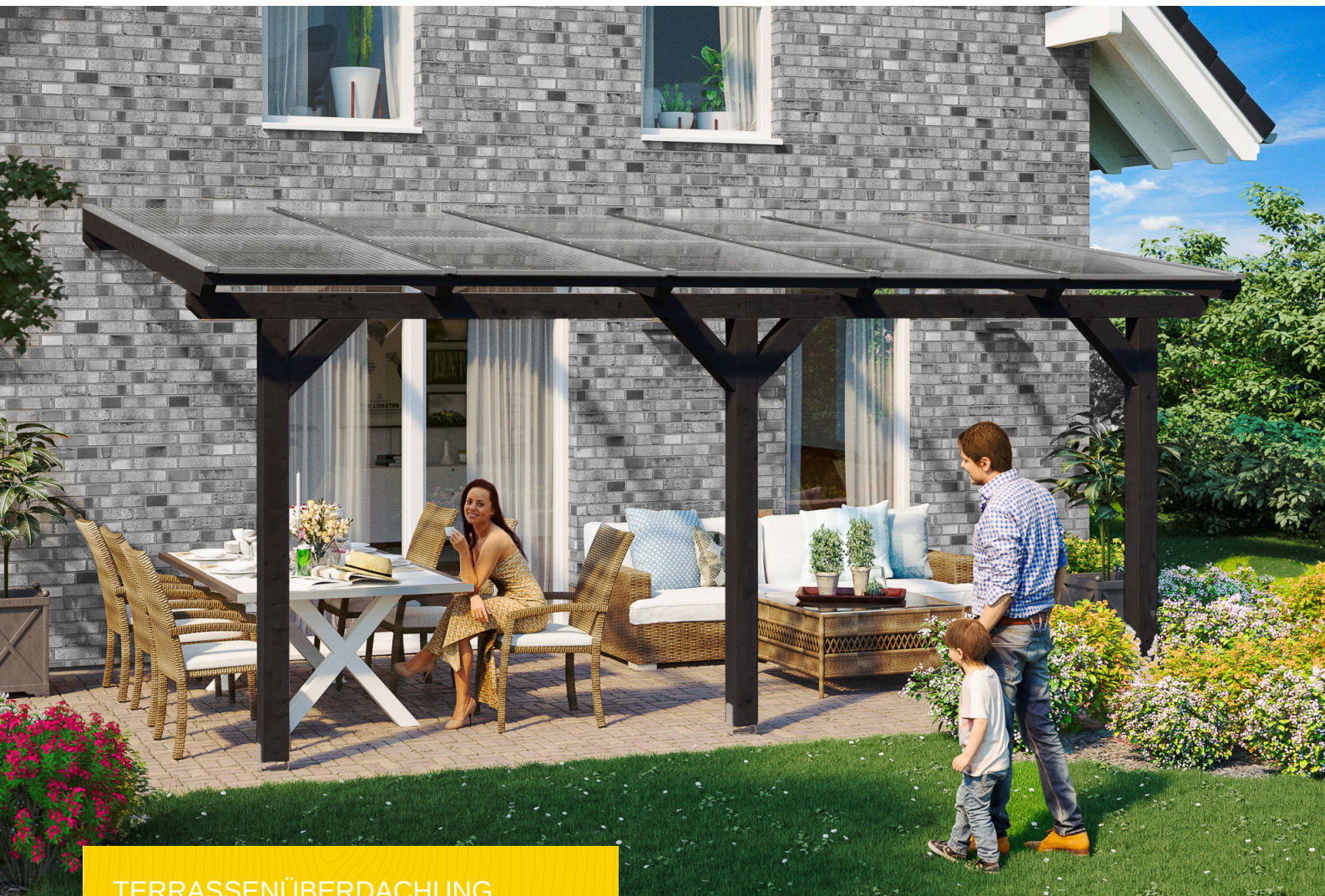
TERRASSENÜBERDACHUNG ANDRIA 541 x 250 cm