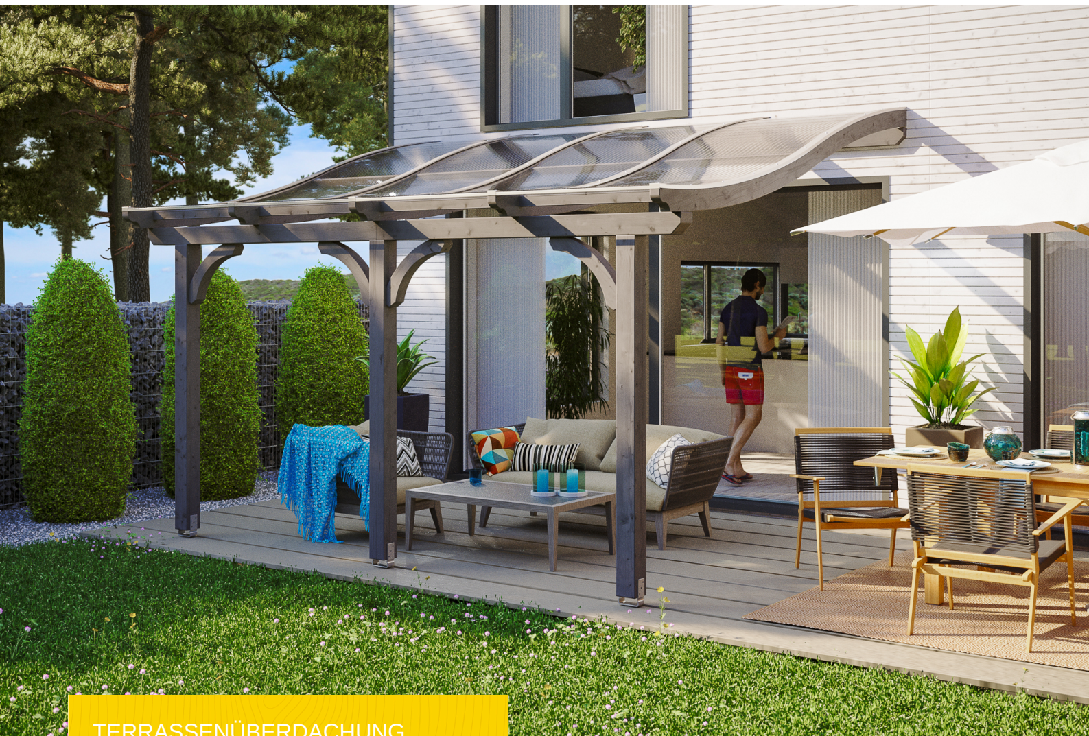
TERRASSENÜBERDACHUNG VENEZIA 434 x 239 cm