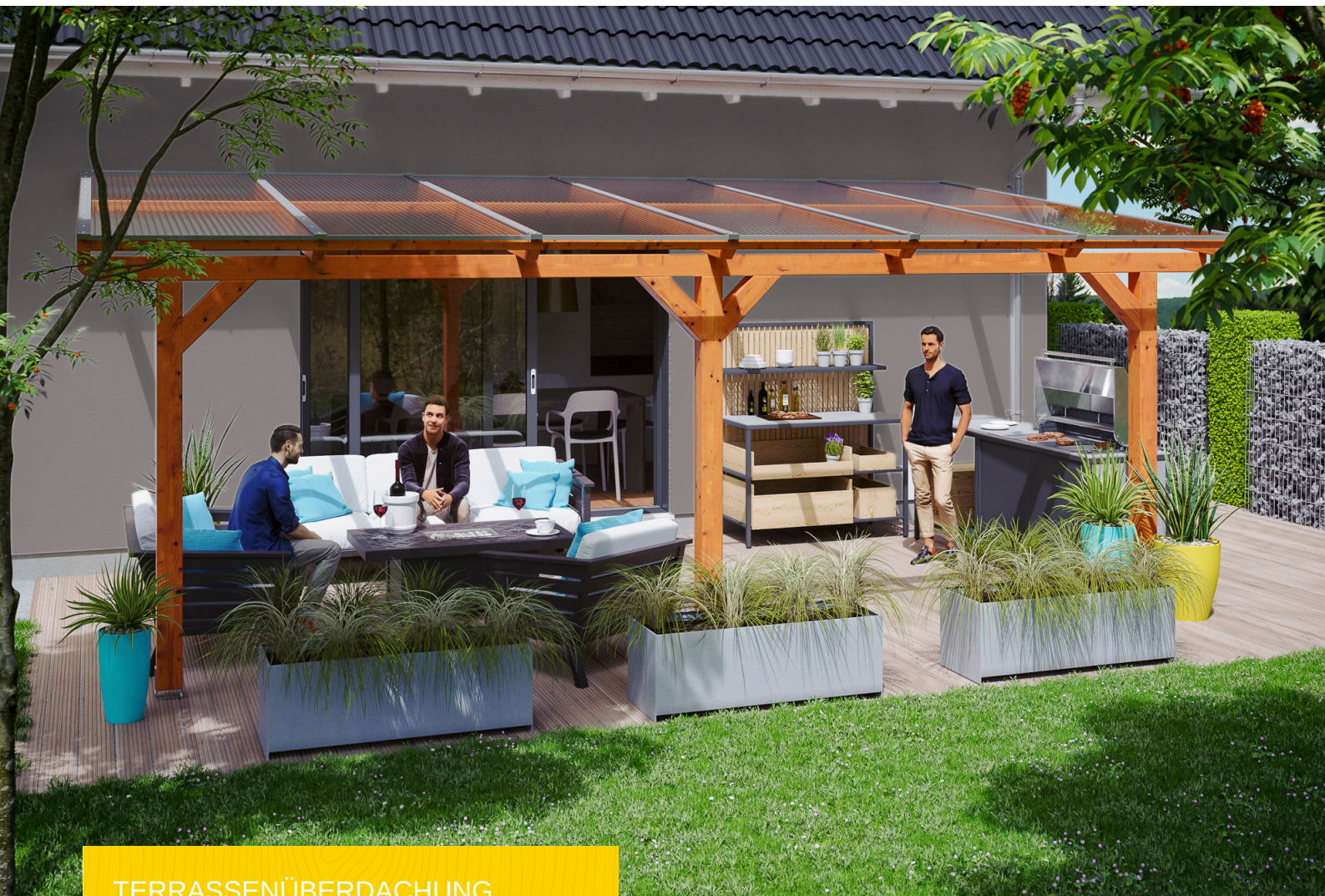
TERRASSENÜBERDACHUNG BORMIO 648 x 400 cm