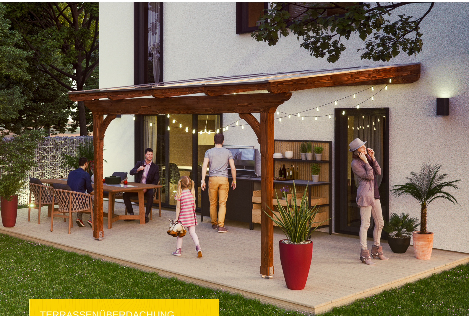
TERRASSENÜBERDACHUNG RAVENNA 434 x 350 cm