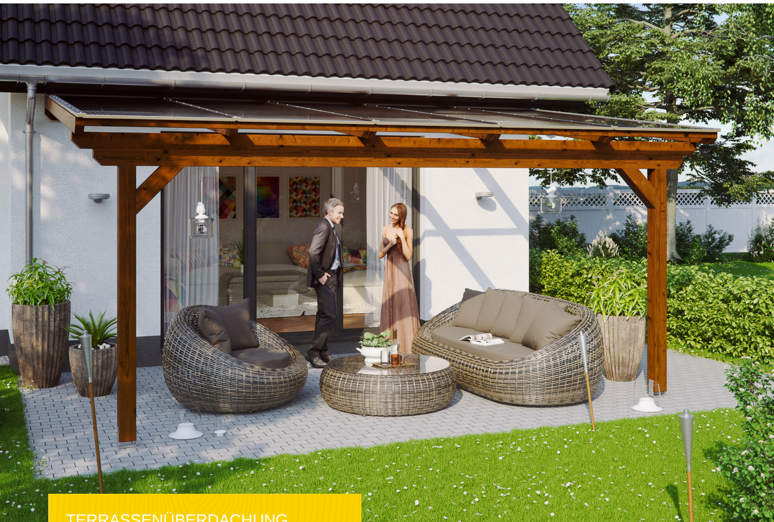
TERRASSENÜBERDACHUNG ANCONA 541 x 350 cm