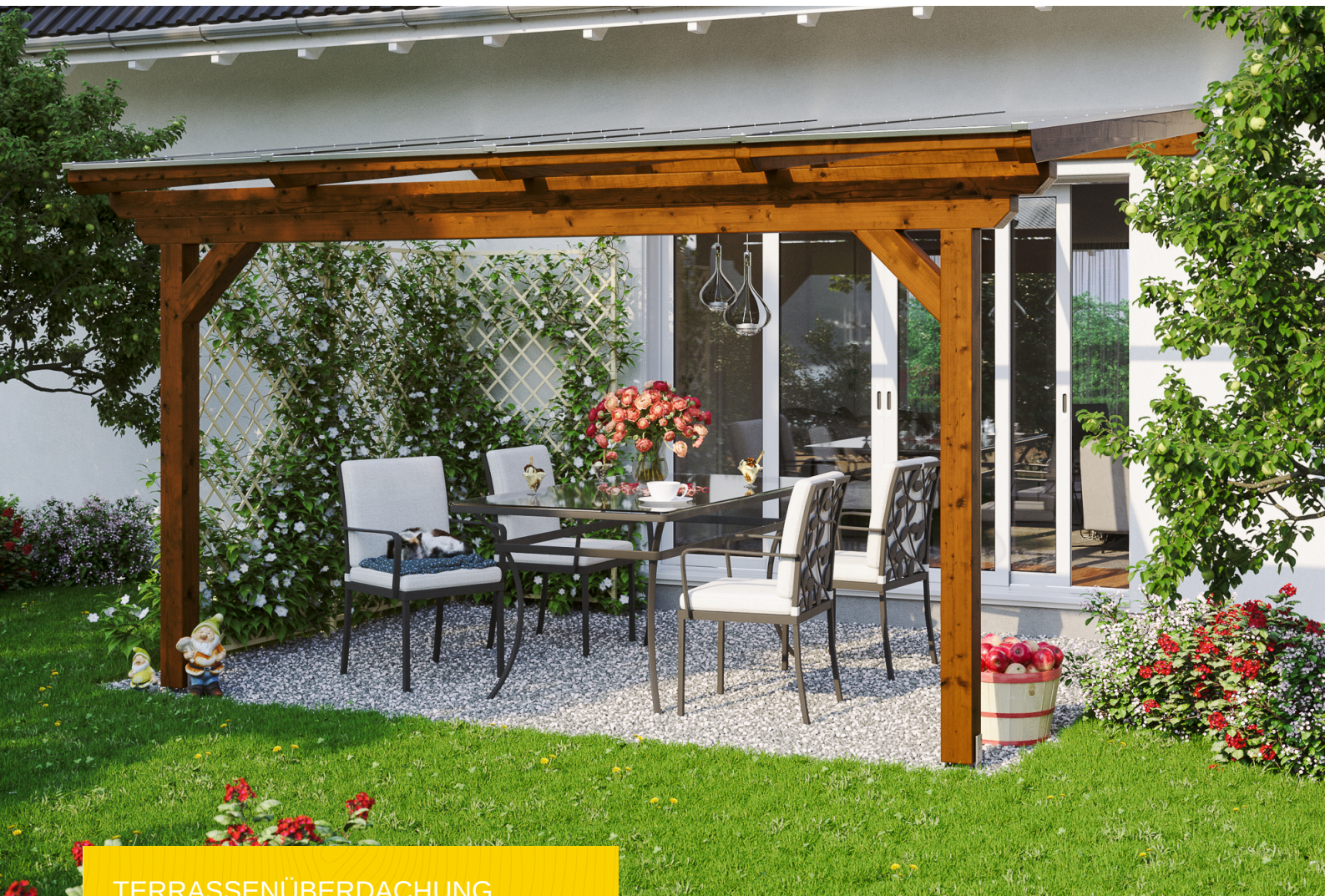
TERRASSENÜBERDACHUNG ANCONA 434 x 250 cm