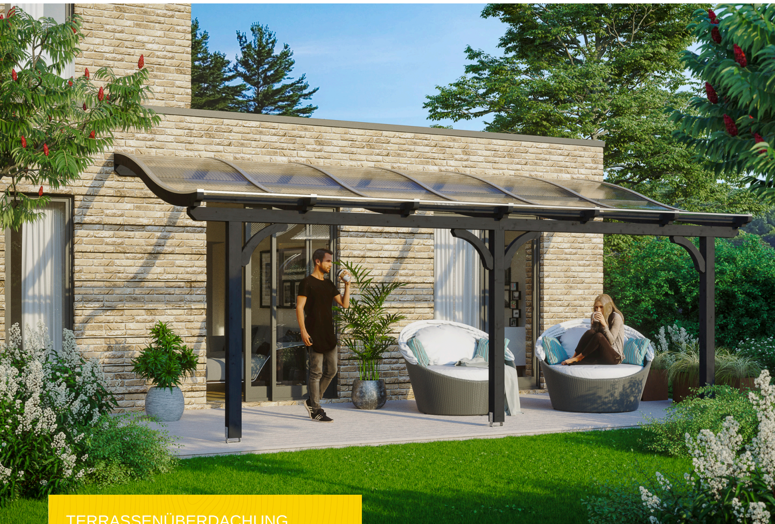
TERRASSENÜBERDACHUNG VENEZIA 648 x 289 cm