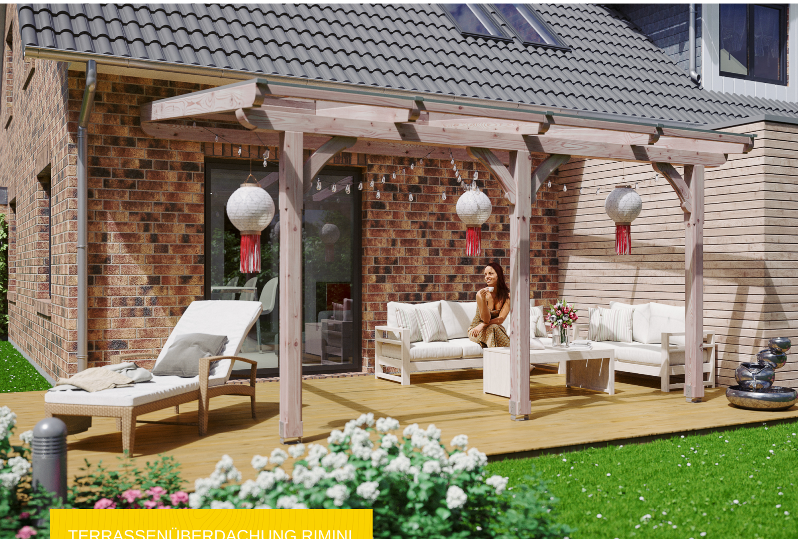
TERRASSENÜBERDACHUNG RIMINI 434 x 350 cm

Massive Konstruktion aus hochwertiger Douglasie