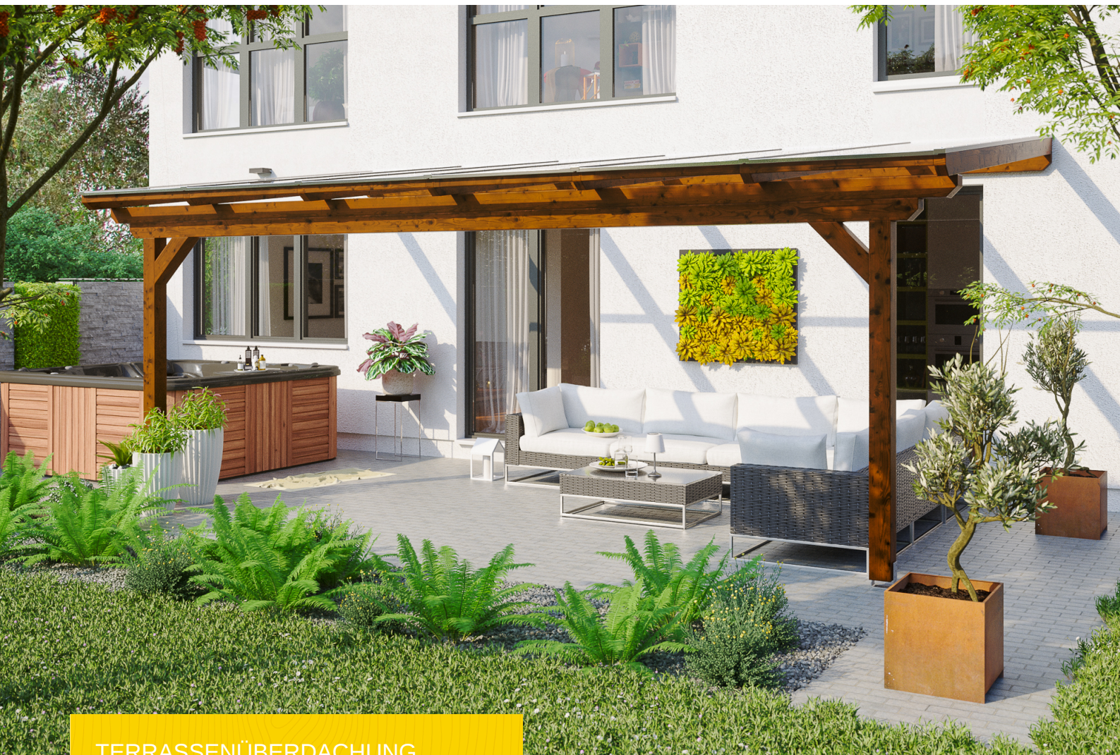
TERRASSENÜBERDACHUNG ANCONA 648 x 400 cm