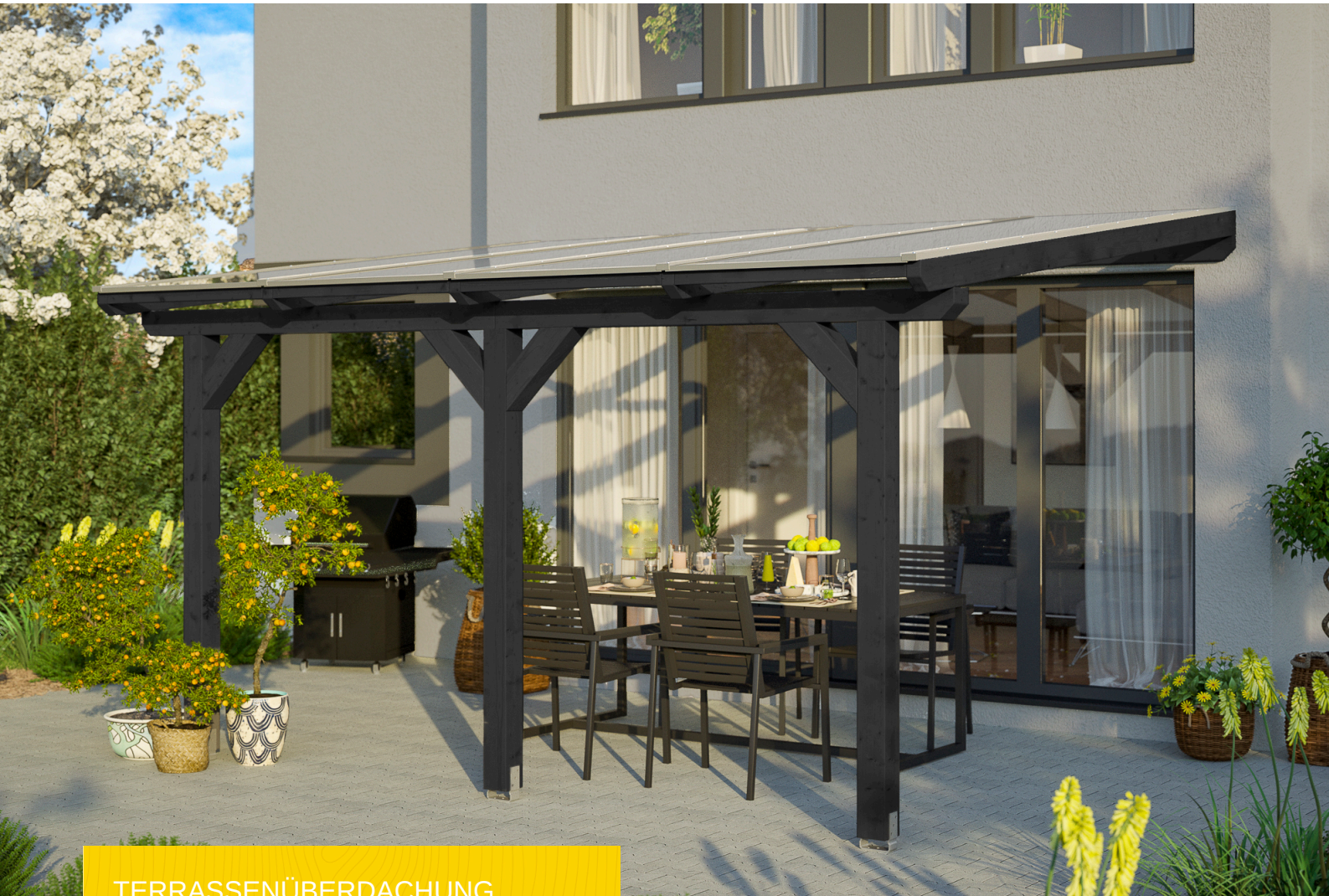
TERRASSENÜBERDACHUNG ANDRIA 434 x 350 cm