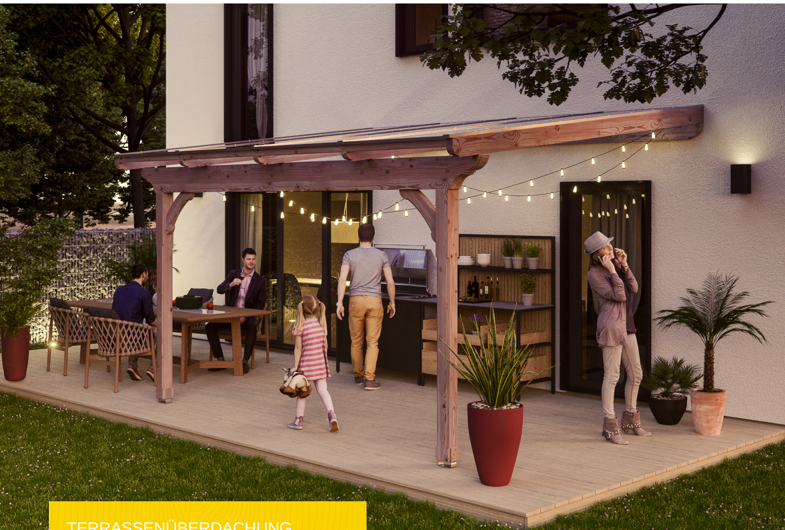
TERRASSENÜBERDACHUNG RAVENNA 434 x 350 cm