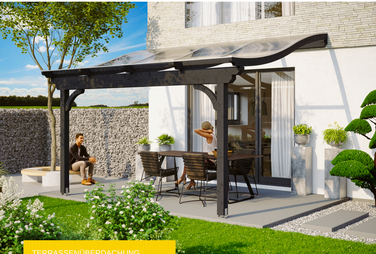
TERRASSENÜBERDACHUNG VERONA 434 x 339 cm