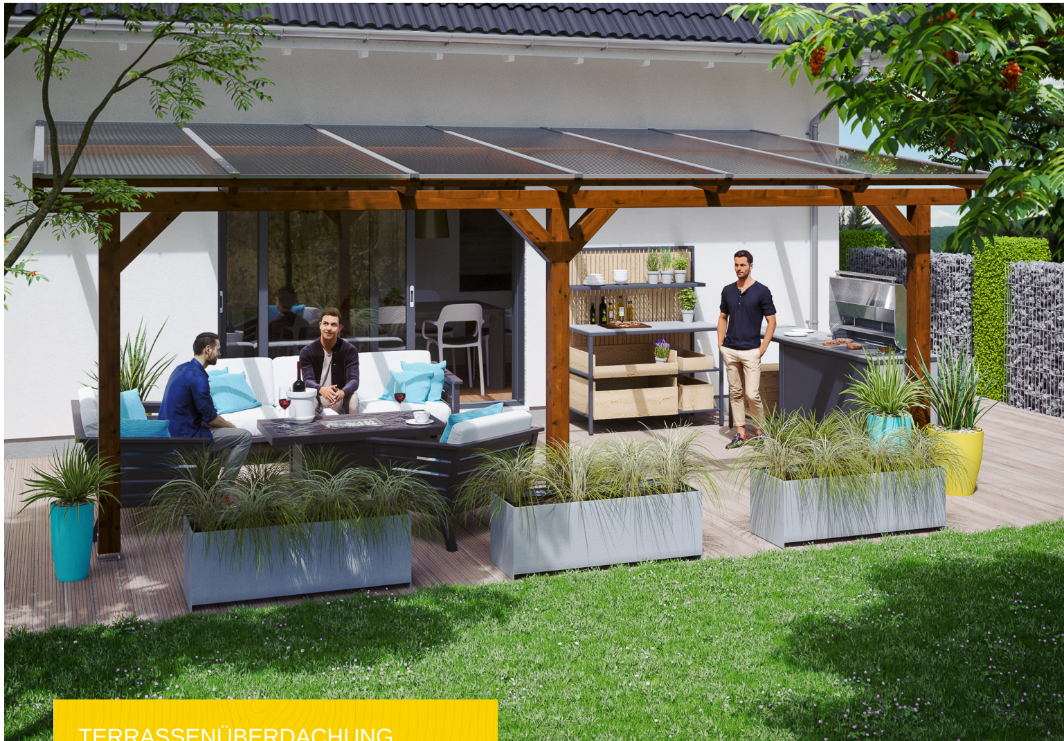
TERRASSENÜBERDACHUNG ANDRIA 648 x 300 cm