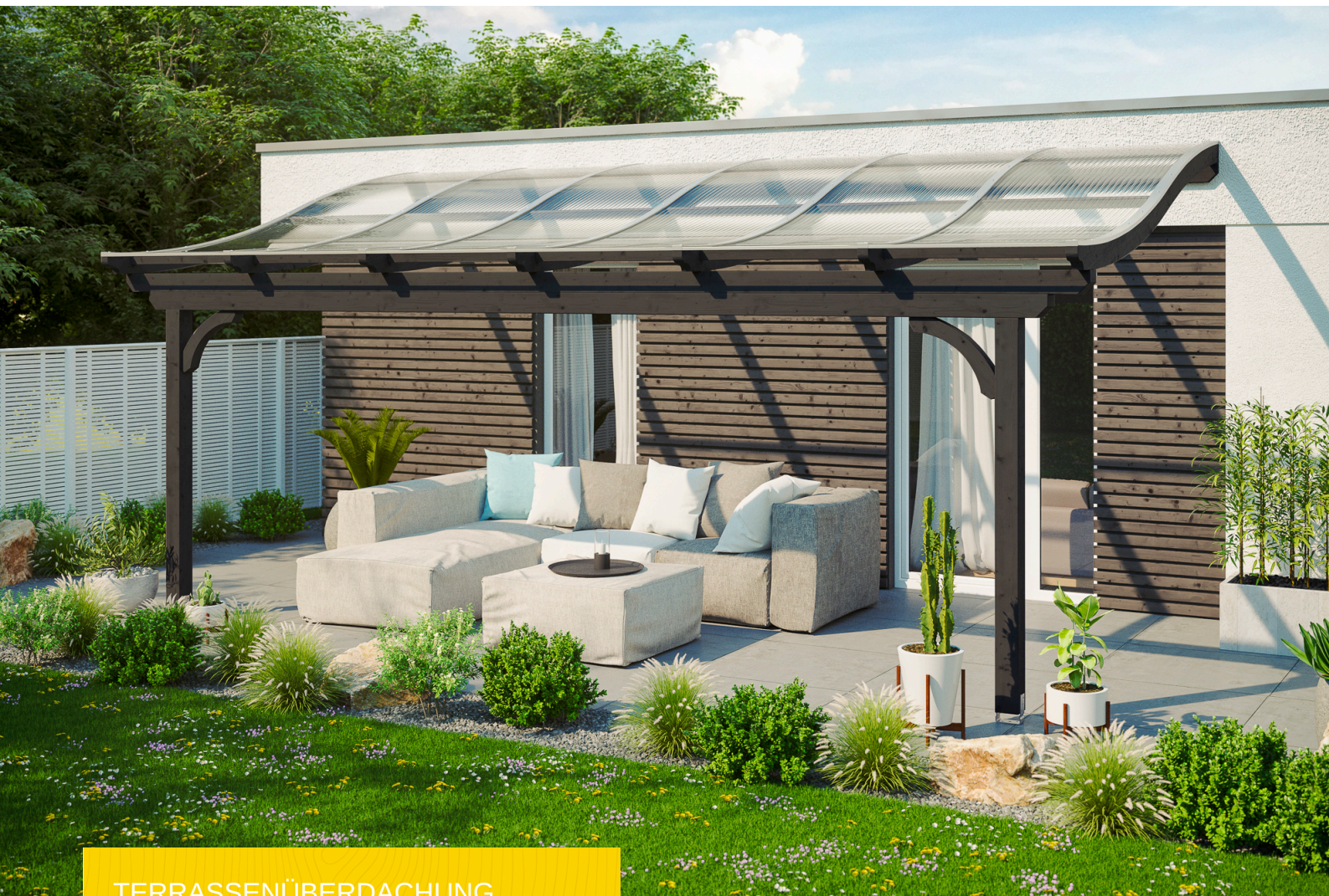
TERRASSENÜBERDACHUNG VERONA 648 x 289 cm