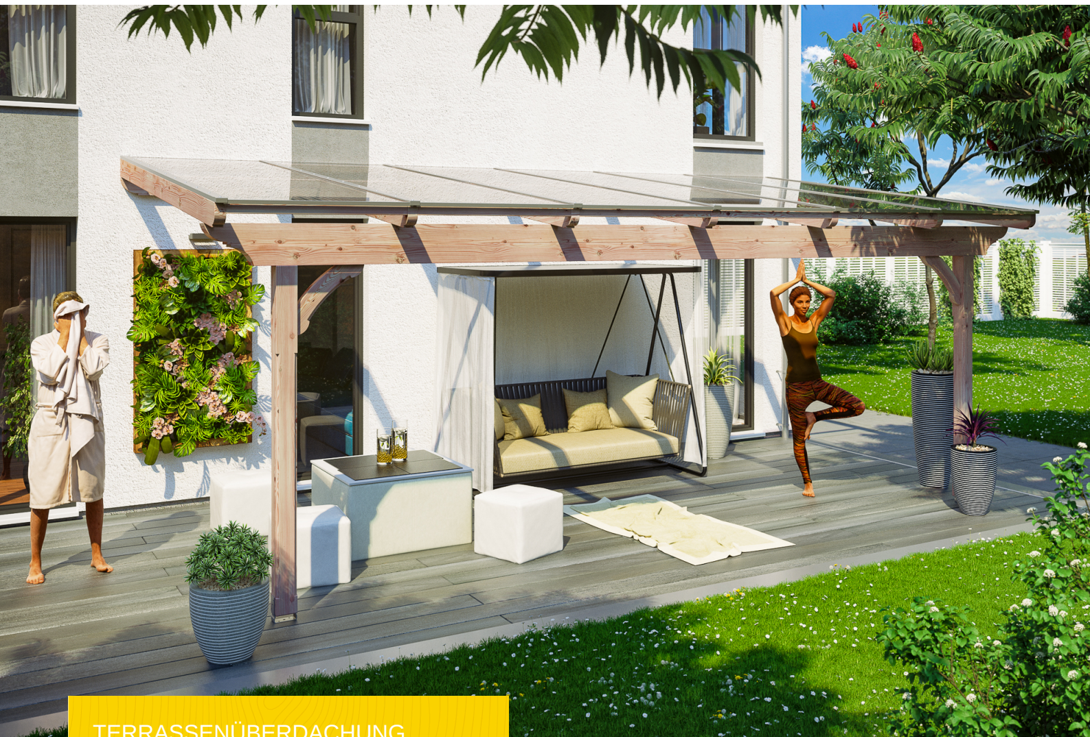
TERRASSENÜBERDACHUNG RAVENNA 648 x 300 cm

Massive Konstruktion aus hochwertiger Douglasie