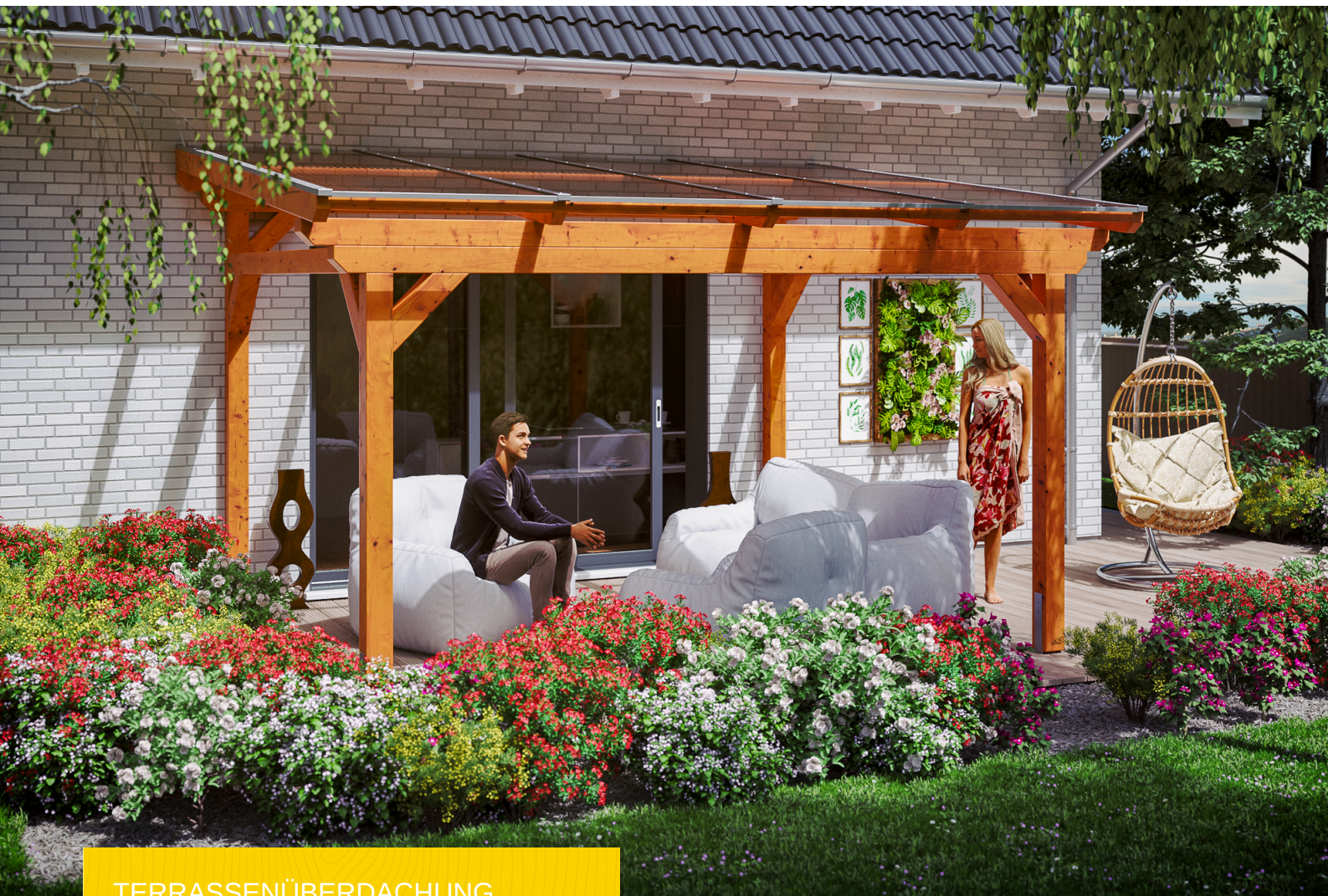
TERRASSENÜBERDACHUNG SANREMO 434 x 350 cm

Massive Konstruktion aus hochwertigem Leimholz (BSH-Fichte)