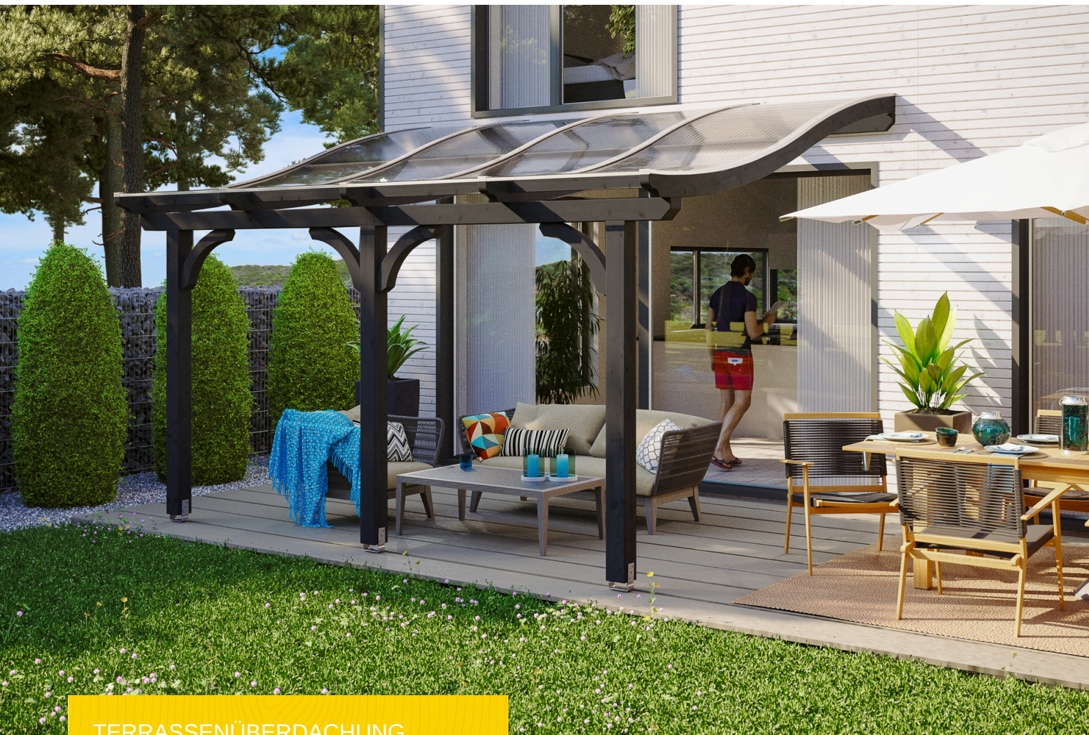
TERRASSENÜBERDACHUNG VENEZIA 434 x 389 cm