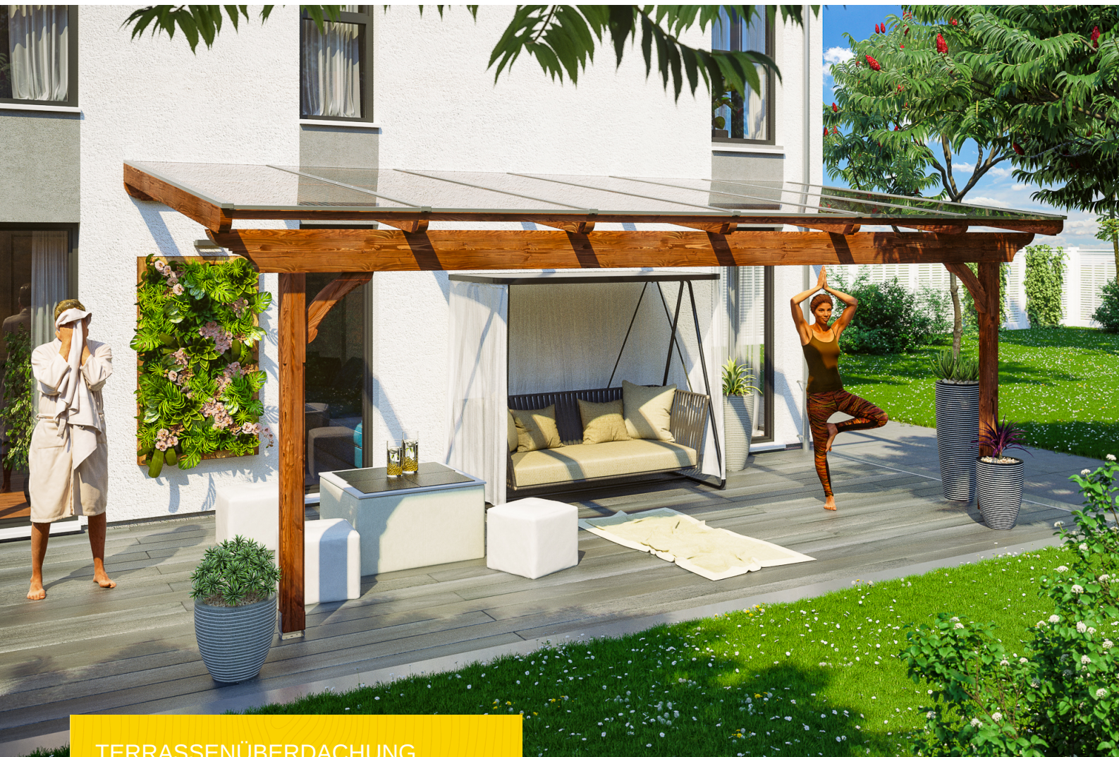
TERRASSENÜBERDACHUNG RAVENNA 648 x 300 cm

Massive Konstruktion aus hochwertiger Douglasie