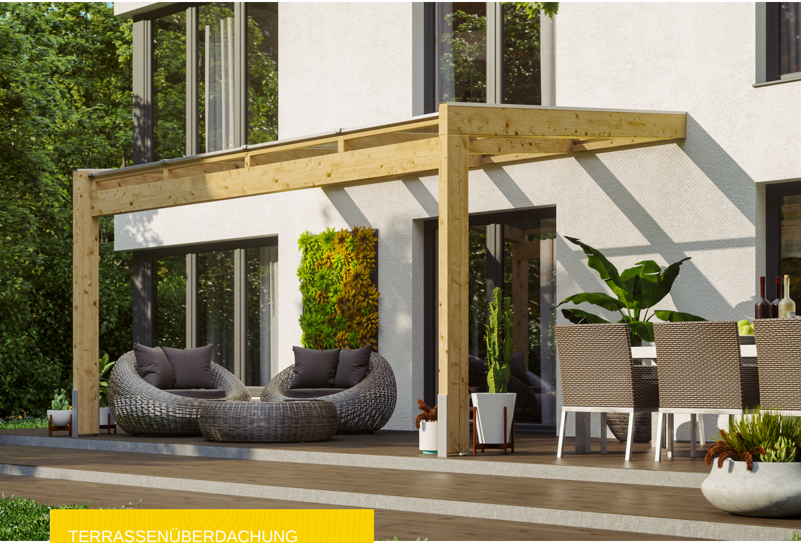
TERRASSENÜBERDACHUNG NOVARA 450 x 359 cm