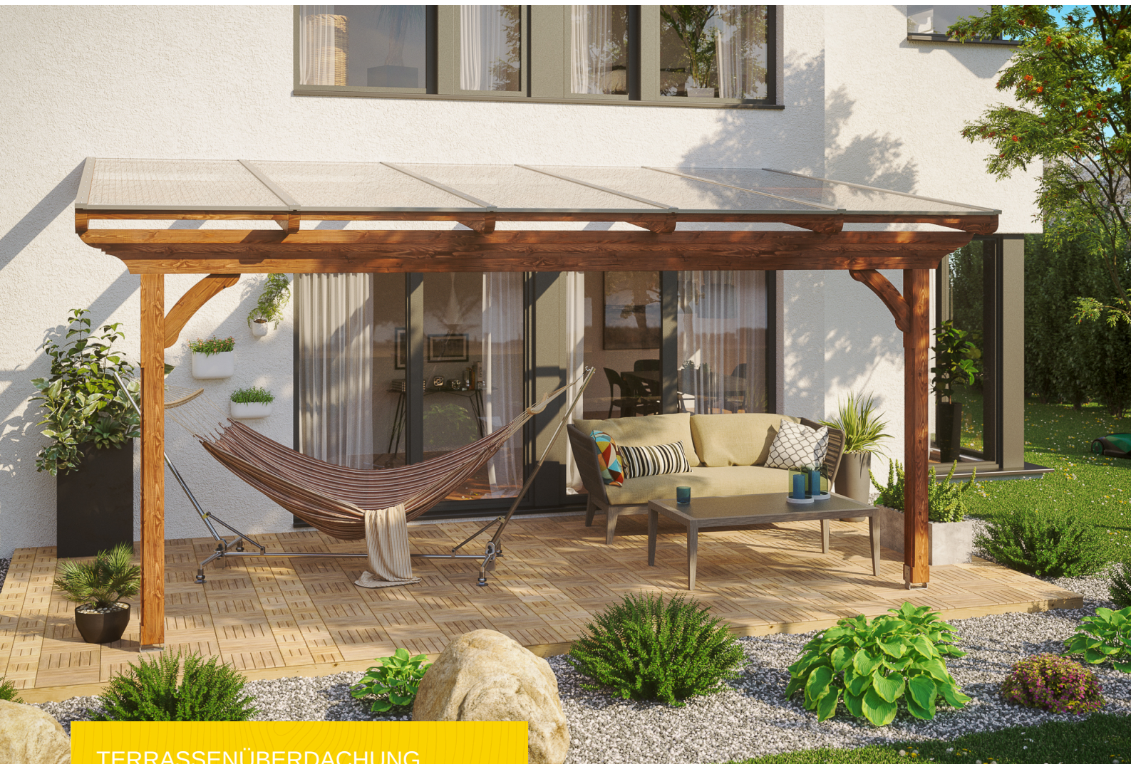
TERRASSENÜBERDACHUNG RAVENNA 541 x 300 cm

Massive Konstruktion aus hochwertiger Douglasie