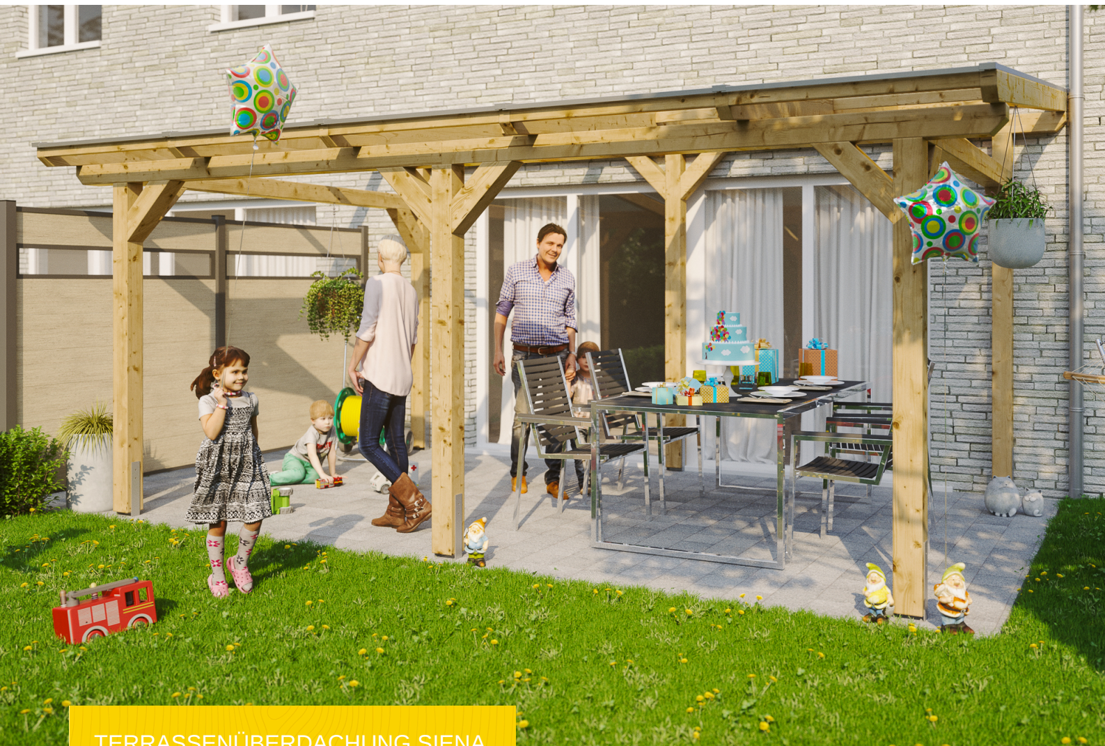
TERRASSENÜBERDACHUNG SIENA 541 x 350 cm

Massive Konstruktion aus hochwertigem Leimholz (BSH-Fichte)