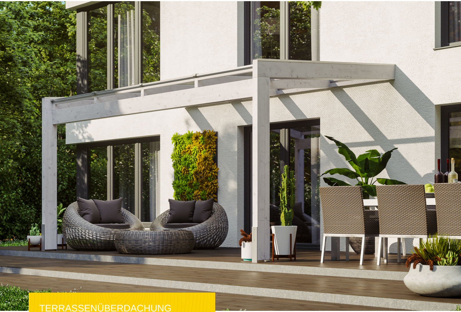
TERRASSENÜBERDACHUNG NOVARA 450 x 359 cm