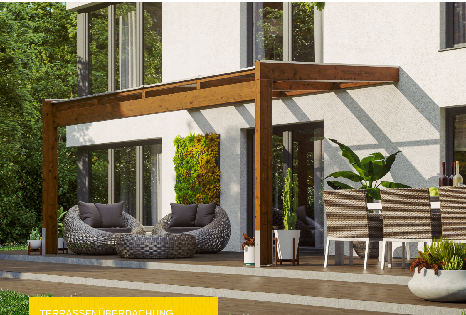
TERRASSENÜBERDACHUNG NOVARA 450 x 259 cm