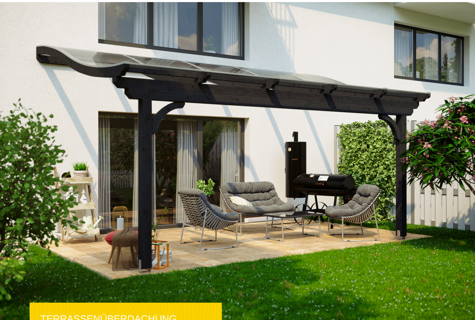
TERRASSENÜBERDACHUNG VERONA 541 x 239 cm