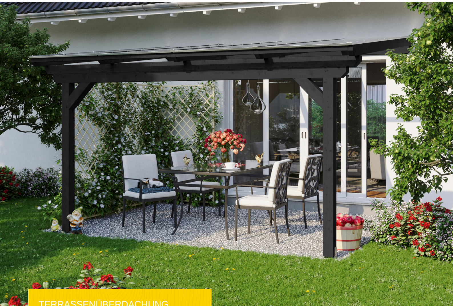
TERRASSENÜBERDACHUNG ANCONA 434 x 300 cm