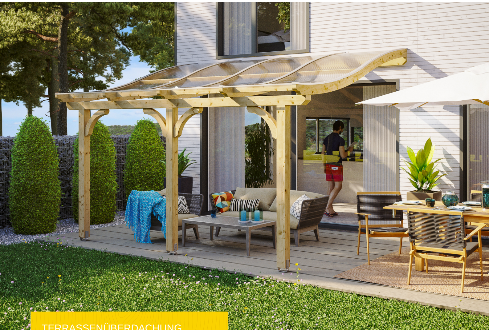
TERRASSENÜBERDACHUNG VENEZIA 434 x 239 cm