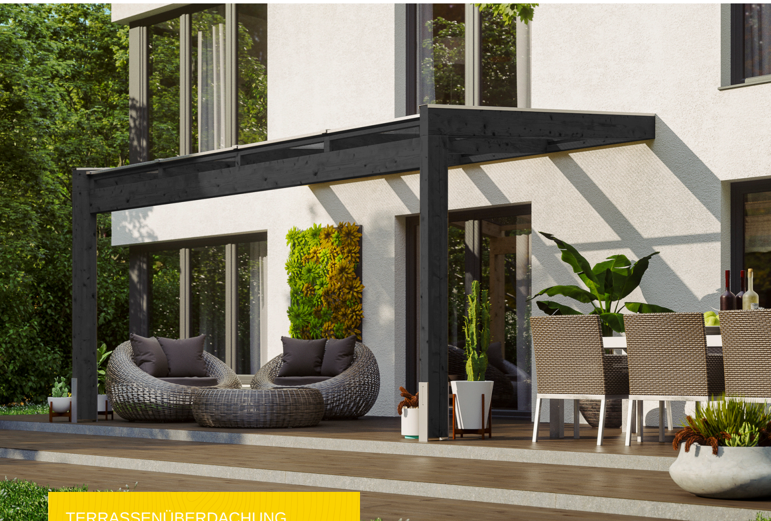
TERRASSENÜBERDACHUNG NOVARA 450 x 359 cm