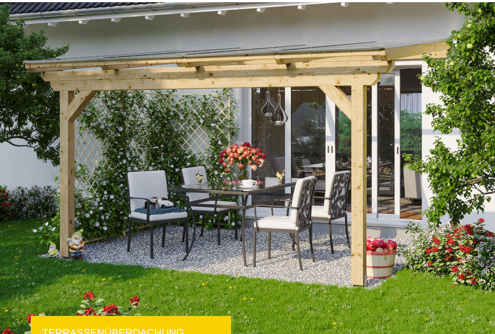
TERRASSENÜBERDACHUNG ANCONA 434 x 300 cm