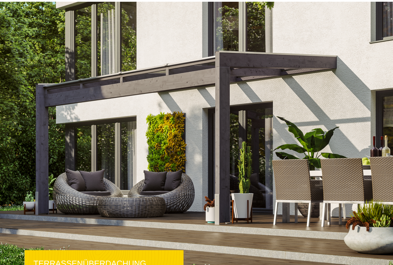
TERRASSENÜBERDACHUNG NOVARA 450 x 259 cm