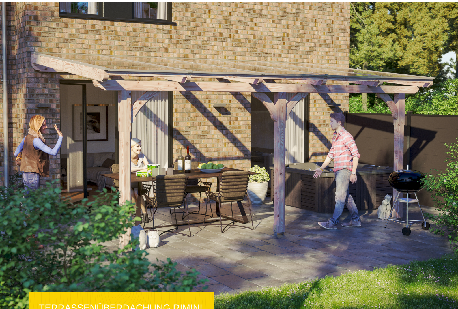
TERRASSENÜBERDACHUNG RIMINI 541 x 250 cm

Massive Konstruktion aus hochwertiger Douglasie