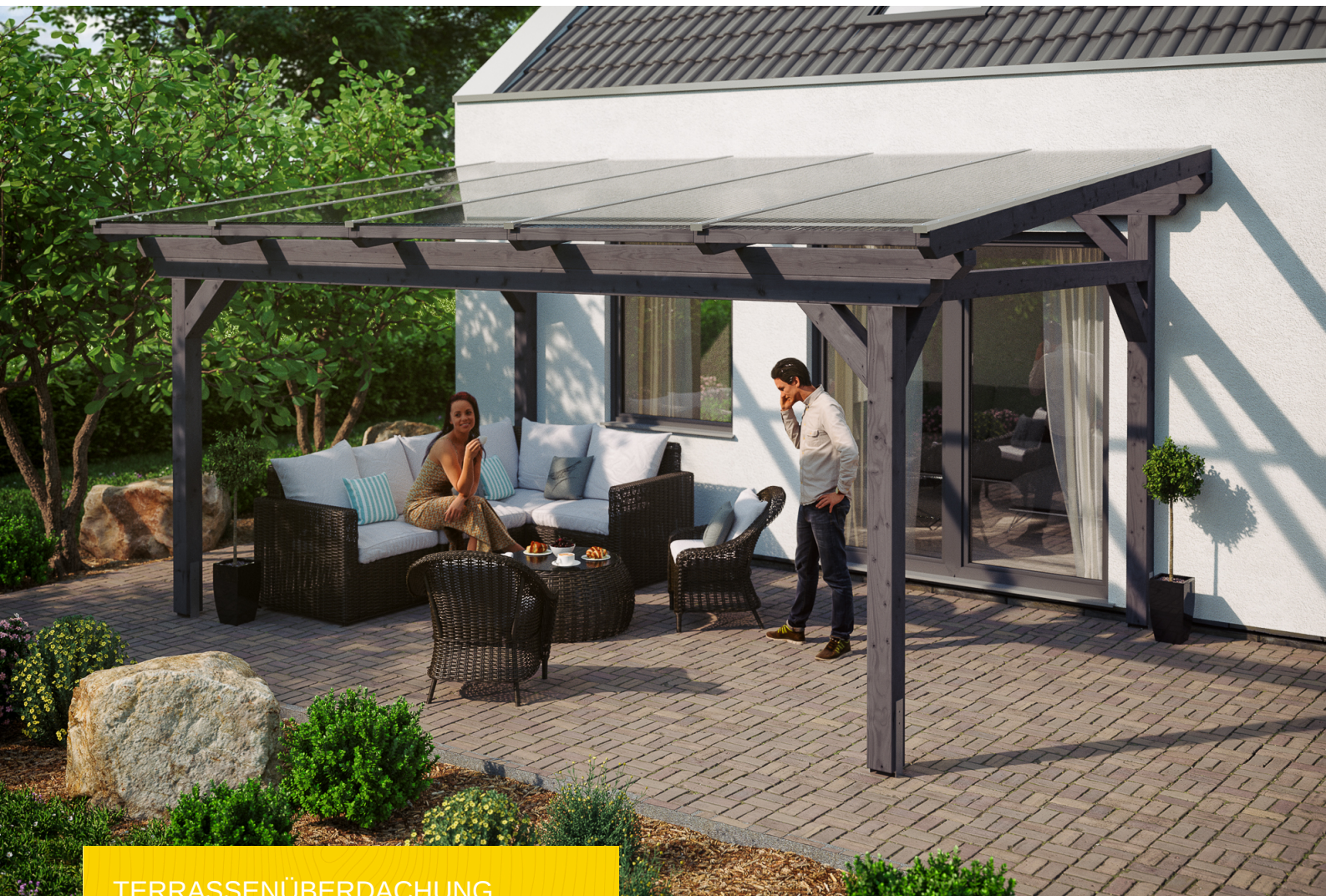
TERRASSENÜBERDACHUNG SANREMO 541 x 400 cm

Massive Konstruktion aus hochwertigem Leimholz (BSH-Fichte)