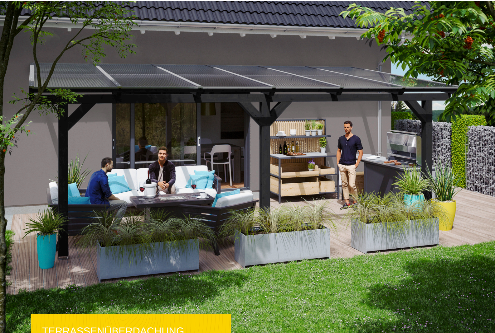
TERRASSENÜBERDACHUNG ANDRIA 648 x 400 cm