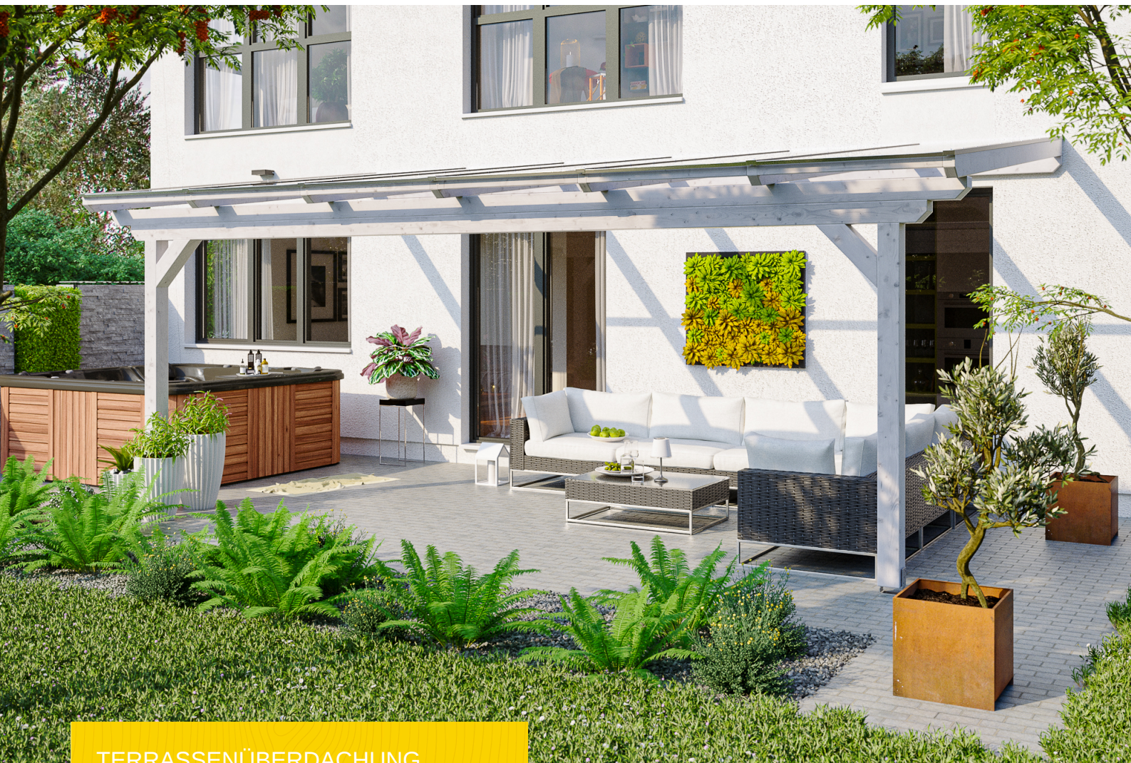
TERRASSENÜBERDACHUNG ANCONA 648 x 300 cm