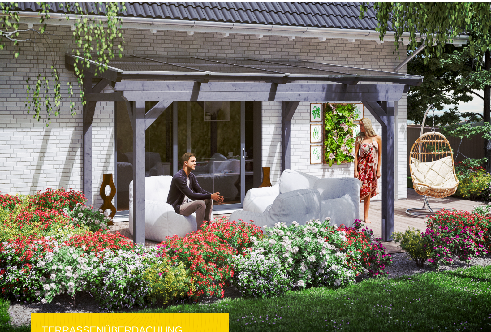
TERRASSENÜBERDACHUNG SANREMO 434 x 400 cm

Massive Konstruktion aus hochwertigem Leimholz (BSH-Fichte)