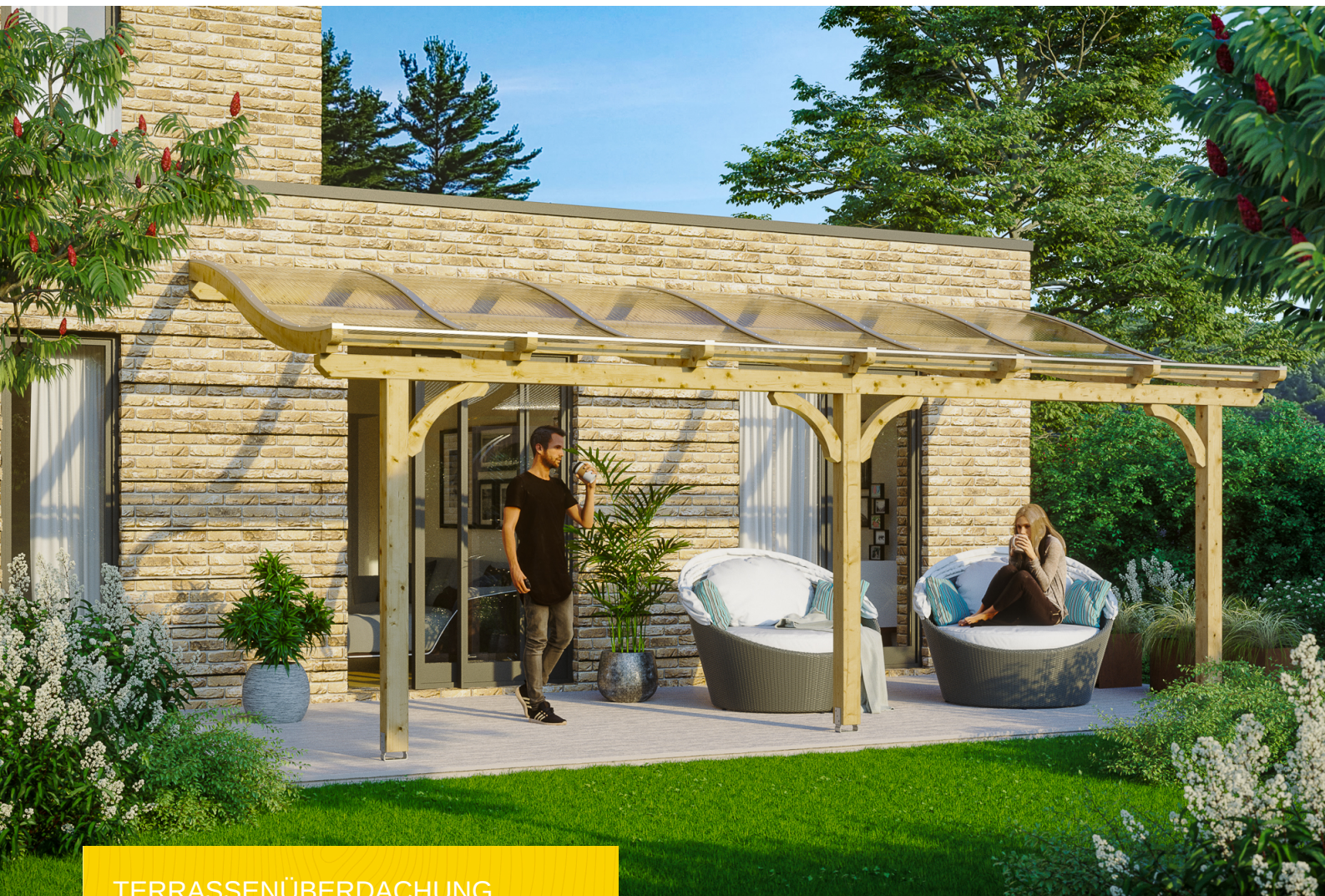
TERRASSENÜBERDACHUNG VENEZIA 648 x 339 cm