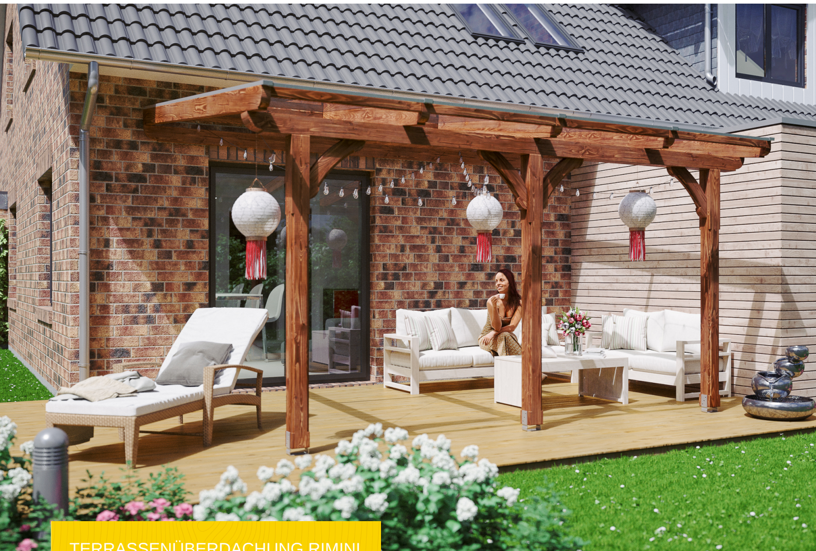
TERRASSENÜBERDACHUNG RIMINI 434 x 300 cm

Massive Konstruktion aus hochwertiger Douglasie