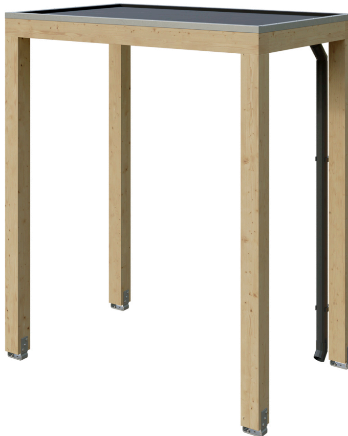
VORDACH FLENSBURG 200 x 125 cm

Massive Konstruktion aus hochwertigem Leimholz (BSH-Fichte)