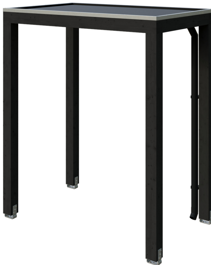
VORDACH FLENSBURG 200 x 125 cm

Massive Konstruktion aus hochwertigem Leimholz (BSH-Fichte)