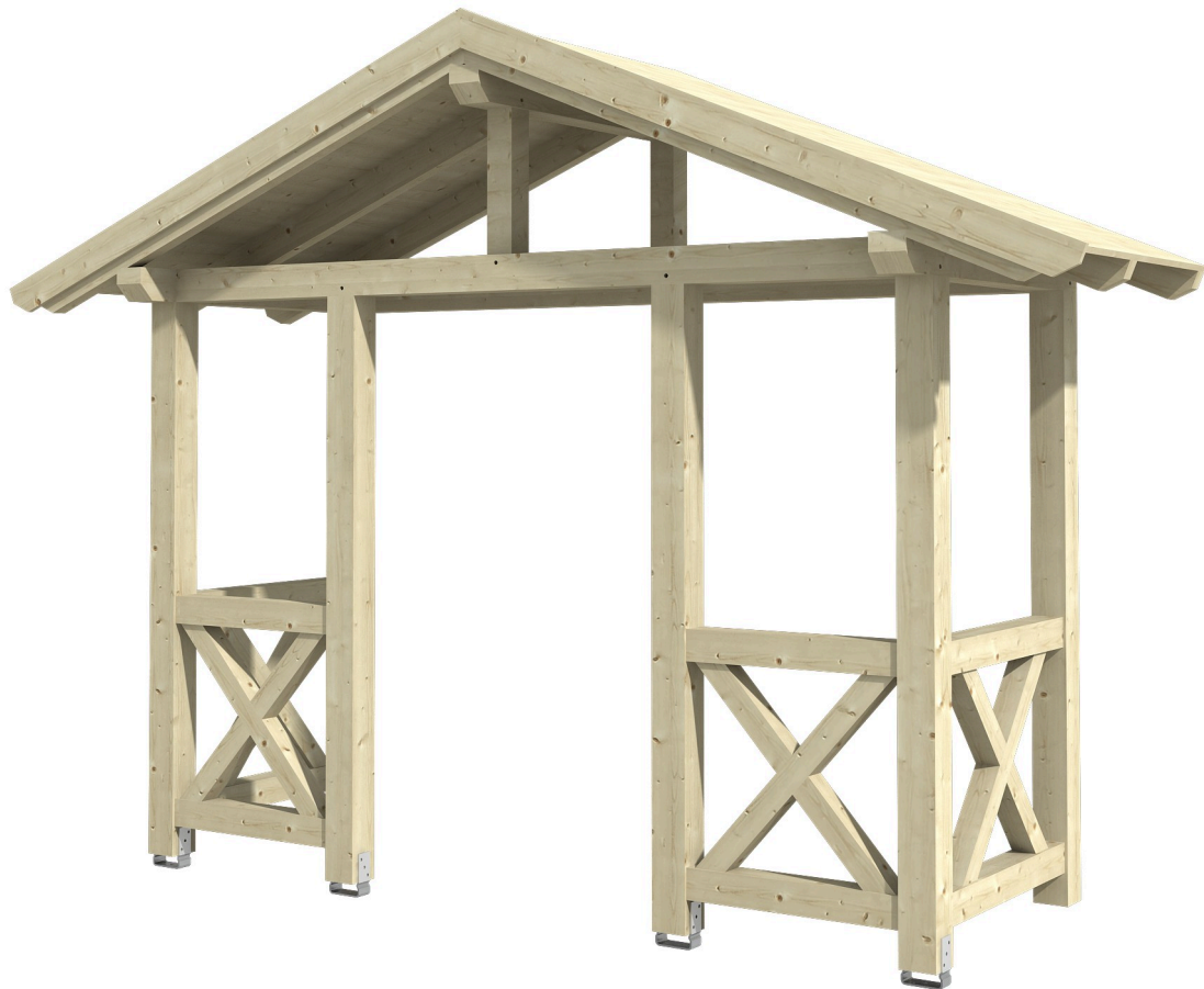
VORDACH STRALSUND 5 360 x 139 cm

Massive Konstruktion aus Konstruktionsvollholz (KVH-Fichte)