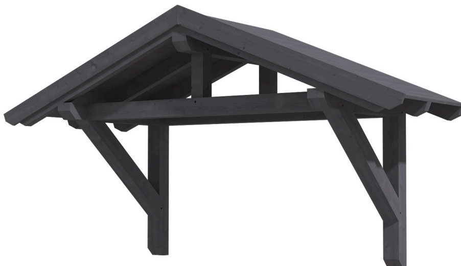
VORDACH STRALSUND 1 289 x 116 cm

Massive Konstruktion aus Konstruktionsvollholz (KVH-Fichte)