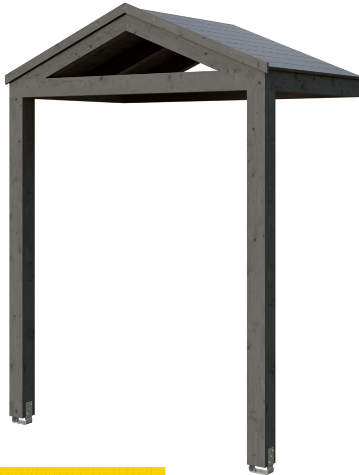
VORDACH SELLIN 205 x 127 cm

Massive Konstruktion aus hochwertigem Leimholz (BSH-Fichte)