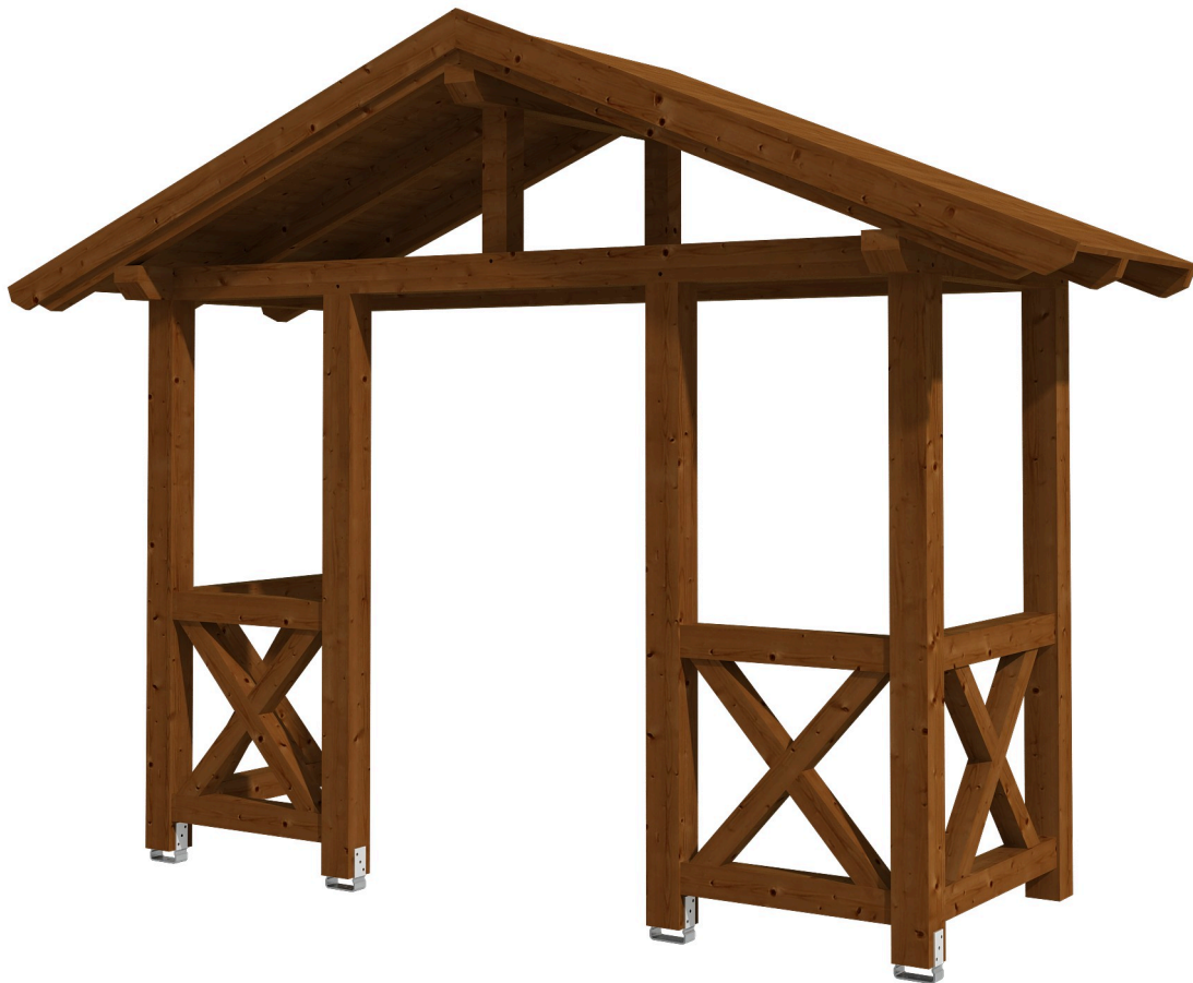
VORDACH STRALSUND 5 360 x 139 cm

Massive Konstruktion aus Konstruktionsvollholz (KVH-Fichte)