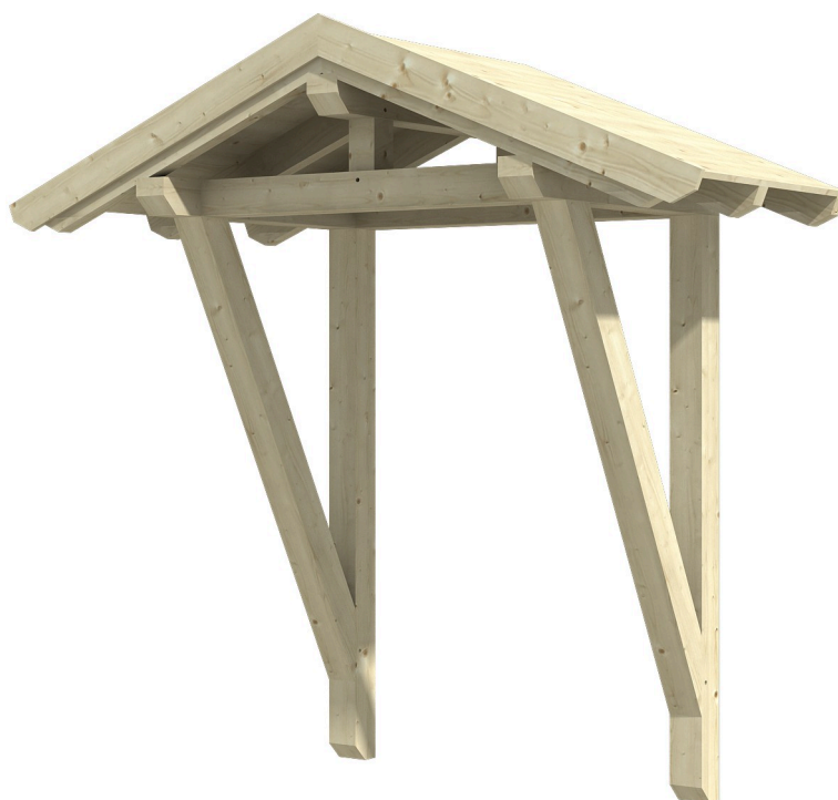
VORDACH SIEGEN 2 247 x 116 cm

Massive Konstruktion aus Konstruktionsvollholz (KVH-Fichte)