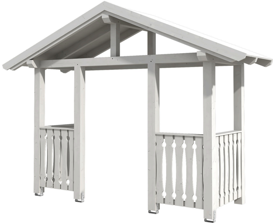
VORDACH STRALSUND 6 360 x 139 cm

Massive Konstruktion aus Konstruktionsvollholz (KVH-Fichte)